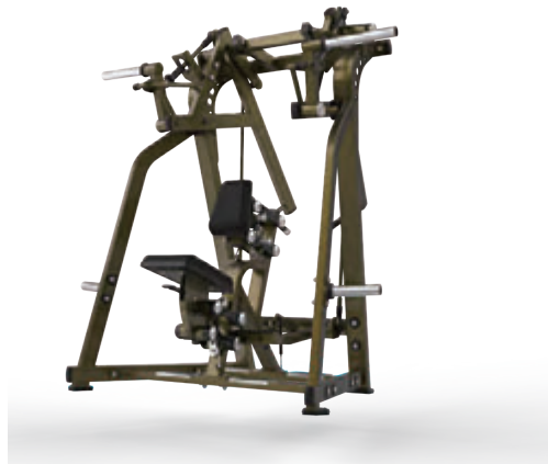
レベルロウ LEVEL ROW — HSPRO-1011