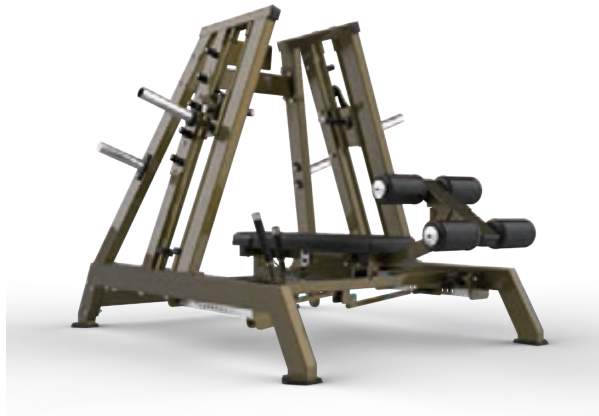
デュアルベンチスミスマシン DUAL BENCH SMITH MACHINE — HSPRO-1007