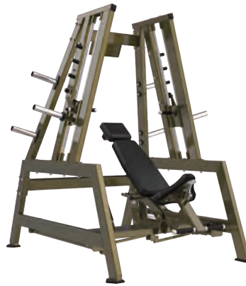
デュアルタワースミスマシン DUAL TOWER SMITH MACHINE — HSPRO-1008