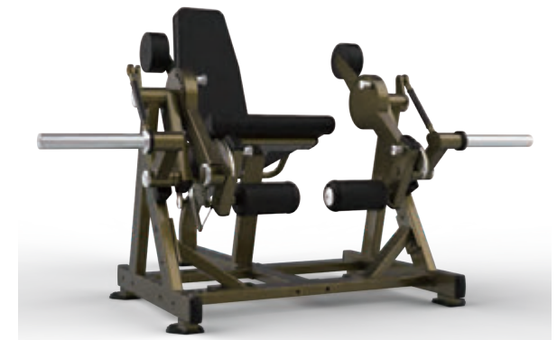
シーテッドレッグエクステンション SEATED LEG EXTENSION — HSPRO-2001