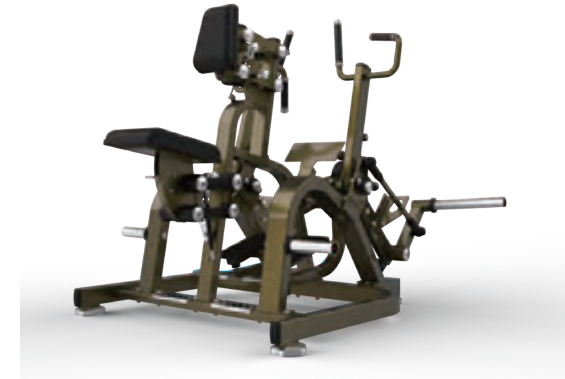
ロウイング ROWING — HSPRO-1009