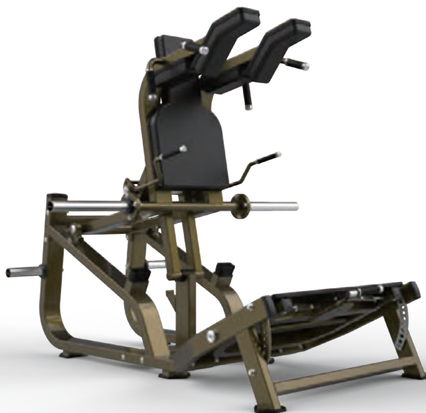
HSPRO (LD) LINE