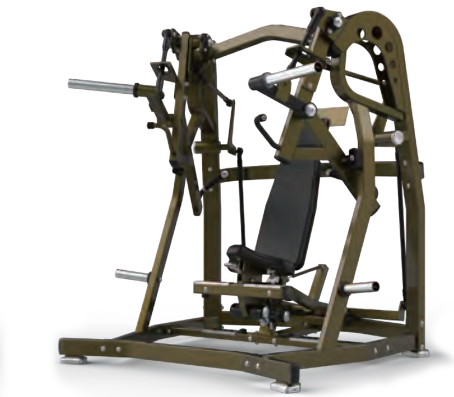
ワイドチェスト WIDE CHEST — HSPRO-1010