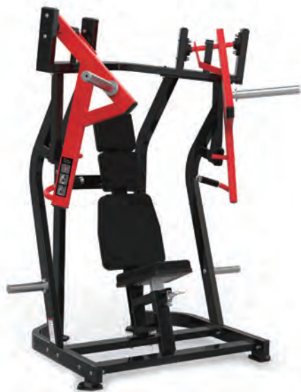
HS (RS) LINE